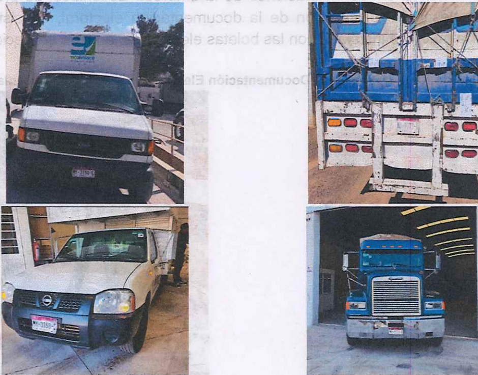
Imagen 10. Traslado de la Documentación Electoral

Una vez concluida con la actividad de carga de los costales con documentación electoral al vehículo, se trasladaron rumbo a la empresa Ecoenlace, ubicada en la Calle Oriente Dos, número 162 ciento sesenta y dos de la Colonia Ciudad Industrial, en la ciudad de Morelia, Michoacán.