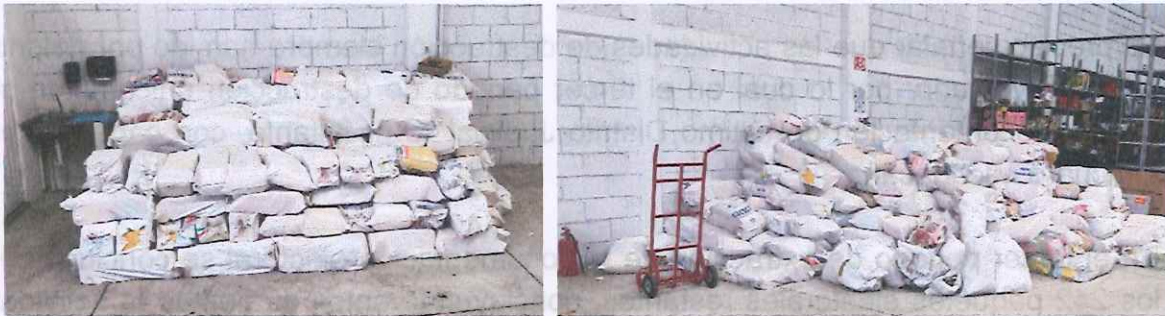
Imagen 13. Documentación Electoral resguardada en Bodega

El presente informe fue presentado en la Sesión Extraordinaria de la Comisión de Organización Electoral del Instituto Electoral de Michoacán de fecha 21 de enero de 2026.