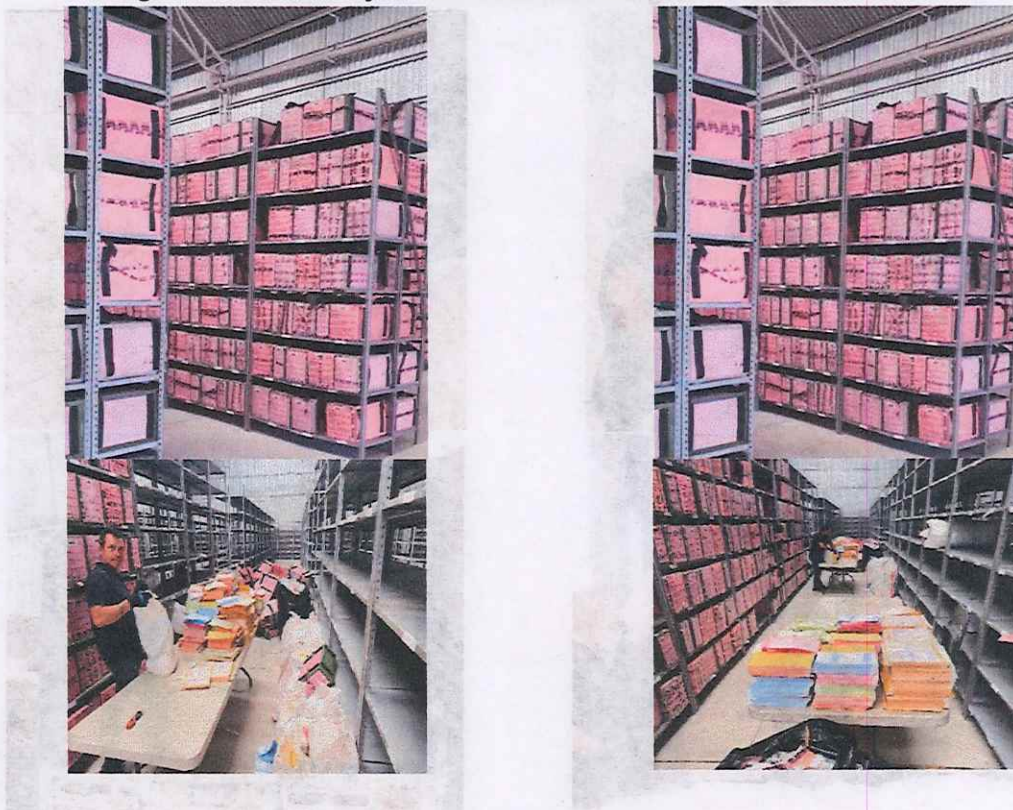
Imagen 8. Extracción y almacenamiento de la Documentación Electoral

Una vez que es extraída la documentación electoral del interior de las cajas paquete electoral, se realiza una revisión general sobre el estado que guardan las mismas, para determinar cuál material puede ser susceptible de reutilizar y cual, por su condición deteriorada, se debe destruir y proceder a su reciclaje correspondiente.