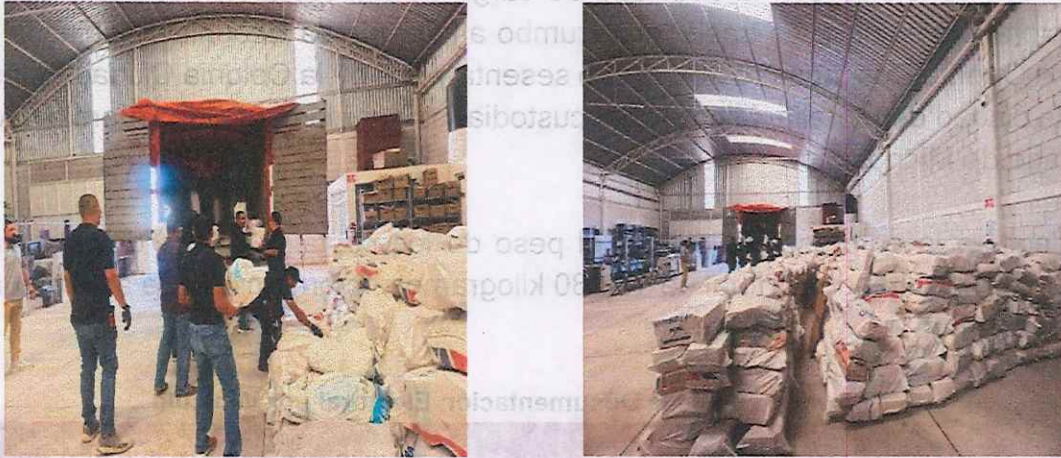
Imagen 2. Carga de la Documentación Electoral

Para el traslado de la documentación electoral a la empresa Ecoenlace se utilizaron los siguientes vehículos: