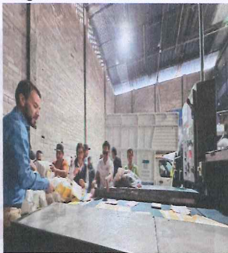
Imagen 4. Destrucción de la Documentación Electoral en la empresa Ecoenlace

Posteriormente, ya en las instalaciones de la empresa Ecoenlace, se procedió a realizar la descarga y trituración de la documentación electoral, consistente en alimentar la maquina instalada con las boletas electorales, a fin de ser recicladas.