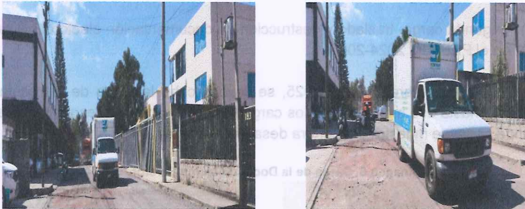
Imagen 6. Traslado de la Documentación Electoral

Una vez concluida con la actividad de carga de los costales con documentación electoral al vehículo, se trasladaron rumbo a la empresa Ecoenlace, ubicada en la Calle Oriente Dos, número 162 ciento sesenta y dos de la Colonia Ciudad Industrial, en la ciudad de Morelia, Michoacán, custodiados por elementos la Guardia Civil del Estado de Michoacán.