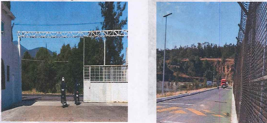
Imagen 3. Traslado de la Documentación Electoral