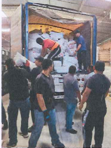
Imagen 11. Destrucción de la Documentación Electoral en la empresa Ecoenlace

Posteriormente, ya en las instalaciones de la empresa Ecoenlace, se procedió a realizar la descarga y trituración de la documentación electoral, consistente en alimentar la maquina instalada con las boletas electorales, a fin de ser recicladas.