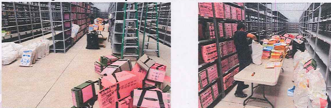
Imagen 12. Extracción y almacenamiento de la Documentación Electoral

Se informa por este medio que las actividades de extracción, separación y almacenamiento de la documentación electoral concluyeron el día 12 de enero del año en curso de un total de 6,447 paquetes electorales de la elección Judicial en el Estado de Michoacán.