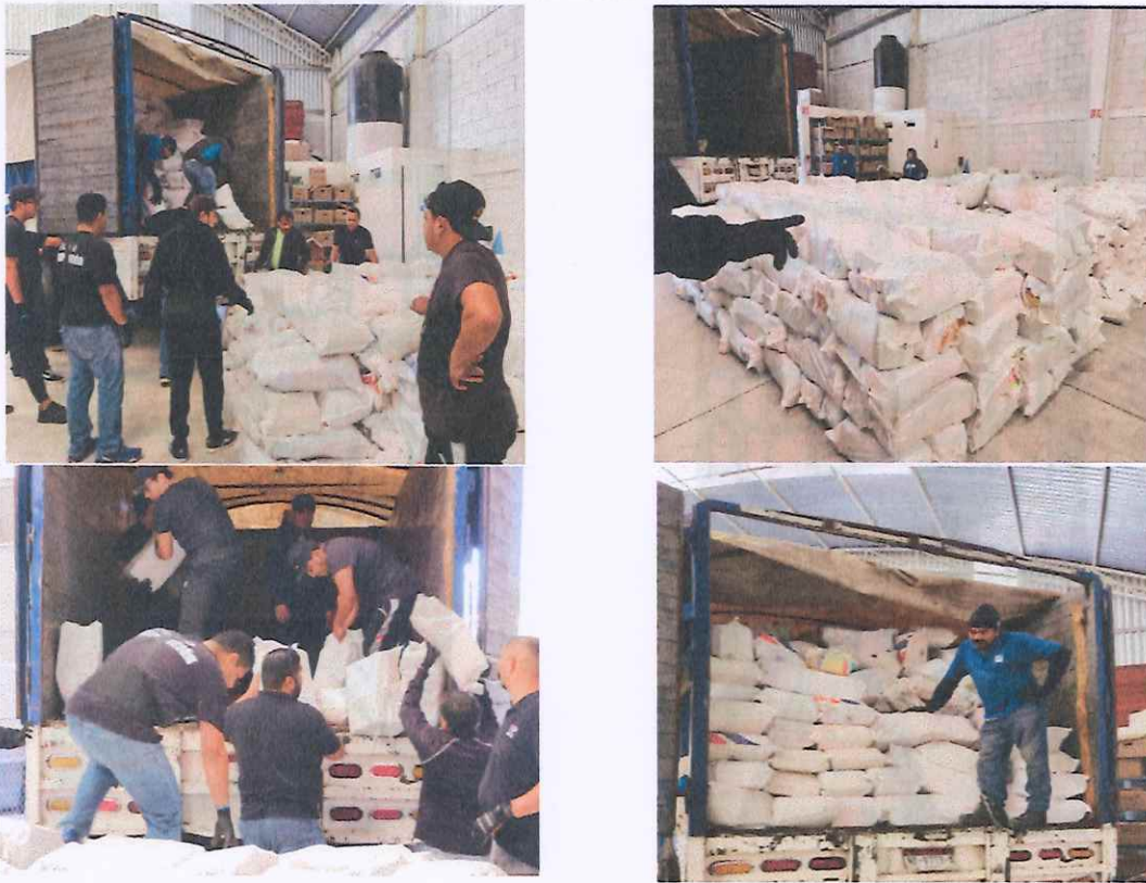
Imagen 9. Carga de la Documentación Electoral

Para el traslado de la documentación electoral a la empresa Ecoenlace se utilizaron los siguientes vehículos: