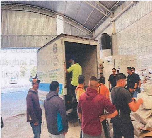
Imagen 5. Carga de la Documentación Electoral

El día 02 de diciembre del año 2025, se llevó a cabo la carga de los costales integrados hasta ese momento en dos cargas, la información correspondiente a la segunda carga se muestra de manera desagregada a continuación: